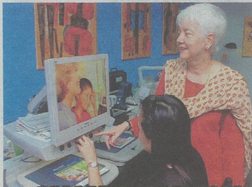
高科技助视器可以将书或报纸的字体放大高达 72 倍，帮助弱视者恢复正常阅读书写的能力。